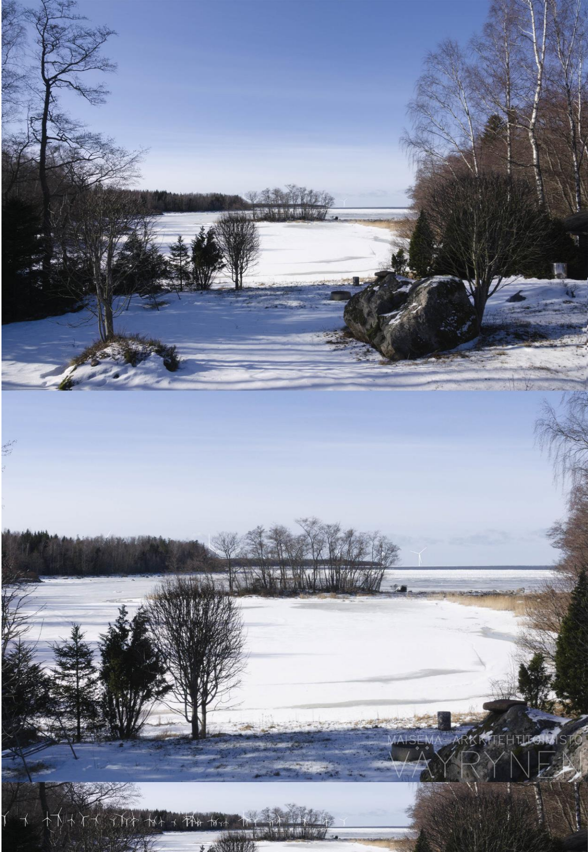
Kuva 1-16. Havainnekuva X kauniskovelosta. Yläkuvan objektiivi on 24 mm ja alakuvan 50 mm. Alakuvassa on valkoisella osoitettu uudet voimalat. Lähimpään hankkeen tuulivoimalaan on etäisyyttä yli 7 kilometriä.