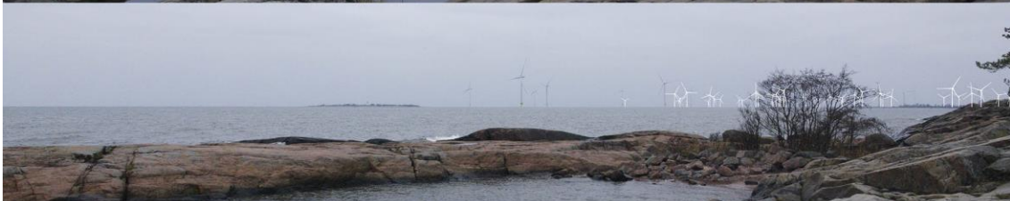
Kuva 1-4. Havainnekuva C Reposaaaren leirintäalueelta syksyllä. Yläkuvan objektiivi on 24 mm ja keskimmäisen kuvan 50 mm. Alakuvassa on valkoisella osoitettu uudet voimalat. Lähimpään hankkeen tuulivoimalaan on etäisyyttä yli 7 kilometriä.