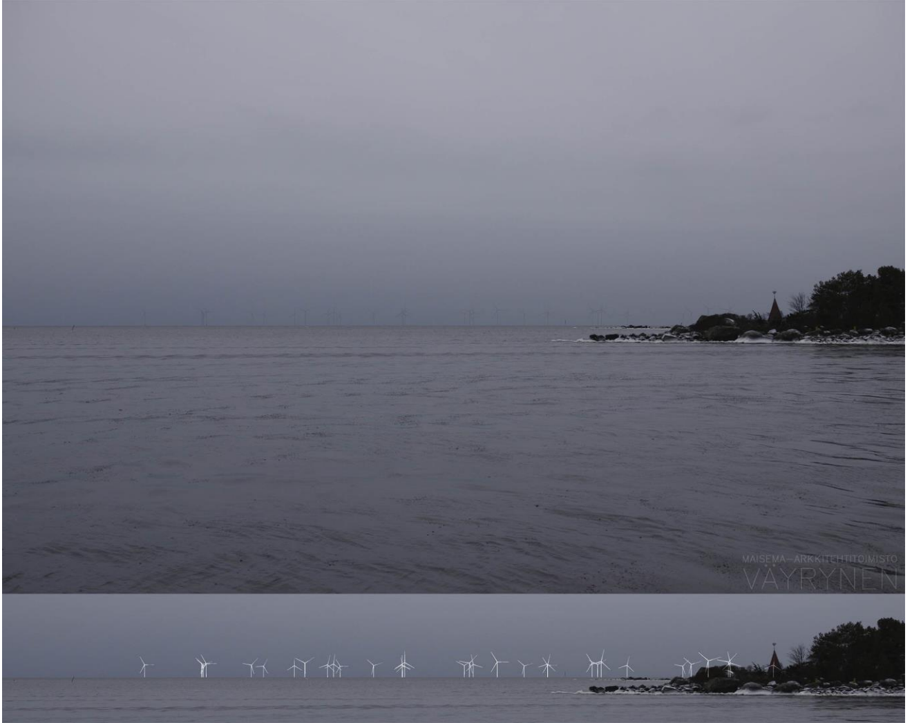
Kuva 1-13. Havainnekuva T Ouraluodosta. Kuvan objektiivi on 50 mm. Alakuvassa on valkoisella osoitettu uudet voimalat. Lähimpään hankkeen tuulivoimalaan on etäisyyttä 15 kilometriä.