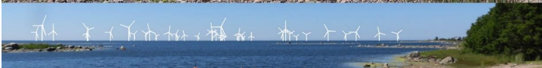
Kuva 1-5. Havainnekuva Q Iso Enskeristä. Kuvan objektiivi on 50 mm. Alakuvassa on valkoisella osoitettu uudet voimalat. Lähimpään hankkeen tuulivoimalaan on etäisyyttä noin 4,5 kilometriä.