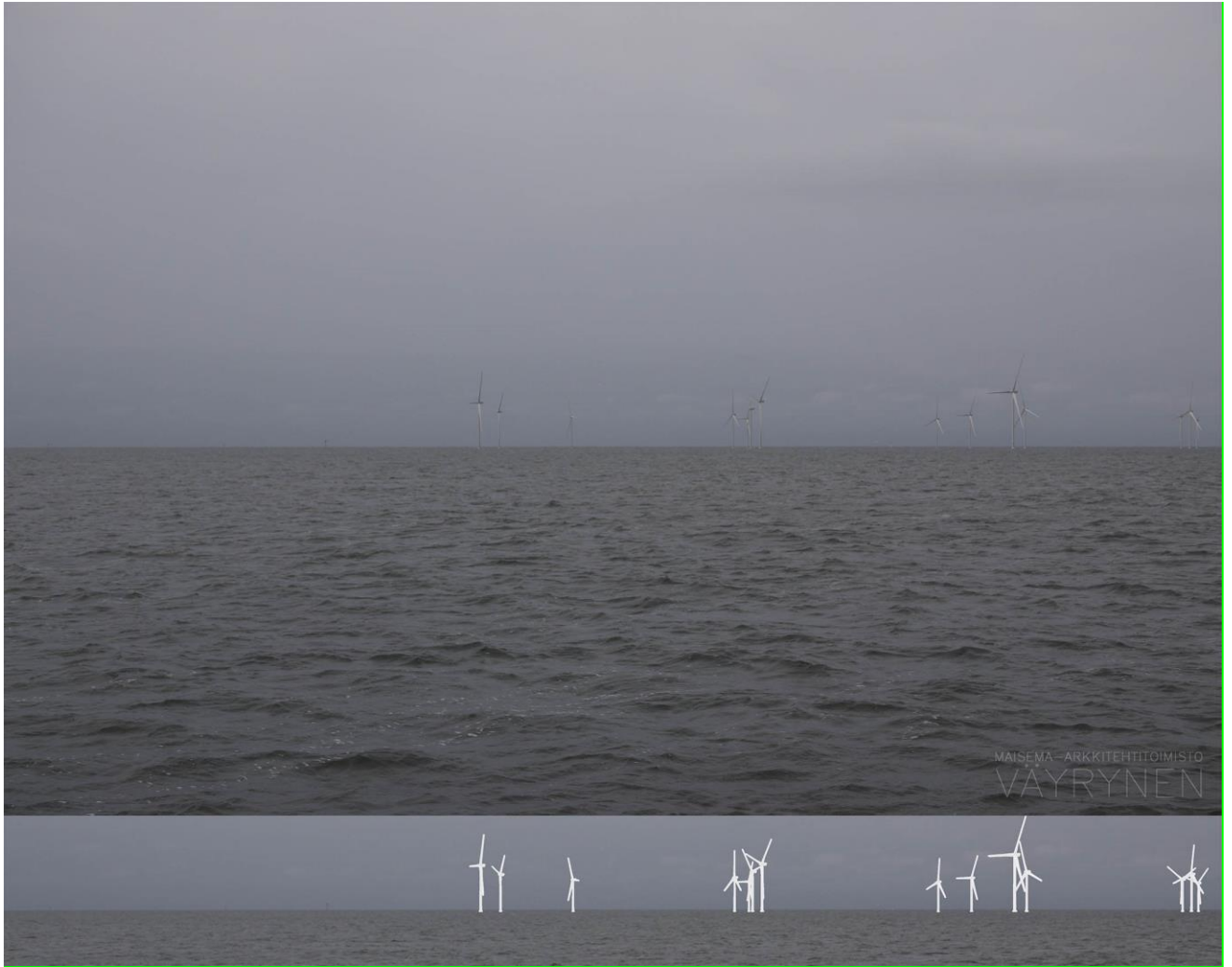
Kuva 1-12. Havainnekuva R Iso Silkkikarin Kumppoosista. Kuvan objektiivi on 50 mm. Alakuvassa on valkoisella osoitettu uudet voimalat. Lähimpään kuvassa näkyvään hankkeen tuulivoimalaan on etäisyyttä 5 kilometriä.