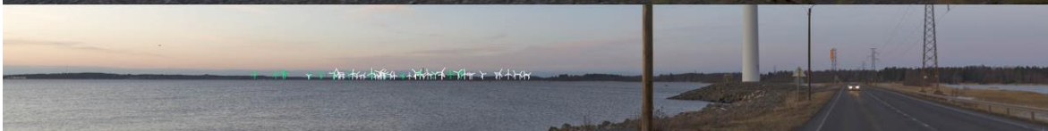
Kuva 1-9. Havainnekuva L Reposaaressa maantieltä. Yläkuvan objektiivi on 16 mm ja alakuvan 50 mm. Alhaalla on valkoisella osoitettu uudet voimalat ja vihreällä olemassa olevat Tahkoluodon merituulipuiston voimalat. Lähimpään hankkeen tuulivoimalaan on etäisyyttä yli 11 kilometriä. Kuvan ottamisen jälkeen, tien vieressä oleva lähin voimala on poistettu.