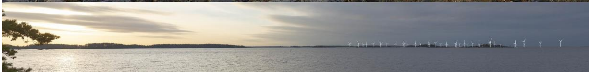
Kuva 1-6. Havainnekuva G Santeen luonnonsuojelualueelta. Yläkuvan objektiivi on 16 mm ja alakuvan 50 mm. Alakuvassa on valkoisella osoitettu uudet voimalat. Lähimpään hankkeen tuulivoimalaan on etäisyyttä noin 13 kilometriä.