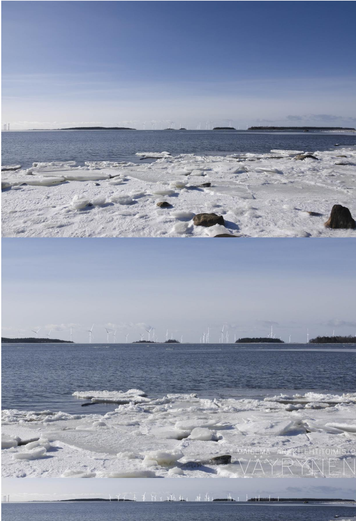
Kuva 1-17. Havainnekuva Y Anttooran Perttelholman rannasta. Yläkuvan objektiivi on 24 mm ja alakuvan 50 mm. Alakuvassa on valkoisella osoitettu uudet voimalat. Lähimpään hankkeen tuulivoimalaan on etäisyyttä yli 7 kilometriä.