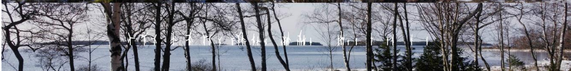
Kuva 1-18. Havainnekuva Z. Anttooran Perttelholmasta. Yläkuvan objektiivi on 24 mm ja alakuvan 50 mm. Alakuvassa on valkoisella osoitettu uudet voimalat. Lähimpään hankkeen tuulivoimalaan on etäisyyttä yli 7 kilometriä.