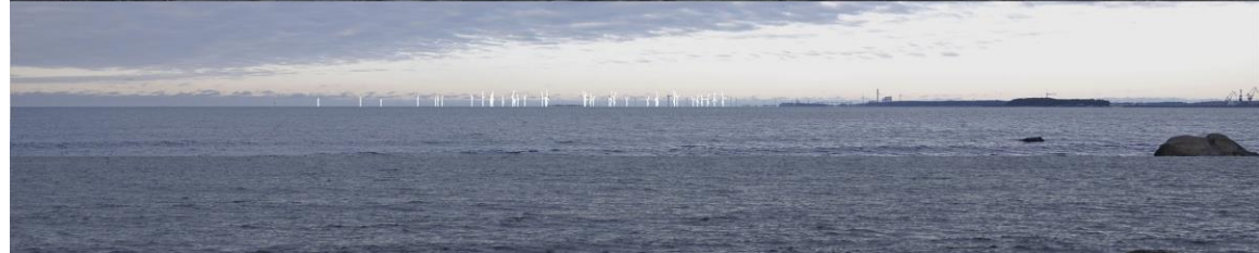
Kuva 1-8. Havainnekuva K Herrainpäivien niemen kärjestä. Yläkuvan objektiivi on 24 mm ja keskimmäisen kuvan 50 mm. Alakuvassa on valkoisella osoitettu uudet voimalat. Lähimpään hankkeen tuulivoimalaan on etäisyyttä lähes 13 kilometriä.